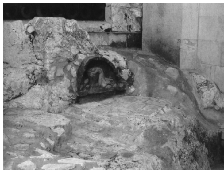
Камень, на котором, по преданию, молился Спаситель

"Торжество православной веры", ч.II, М., 2009 г.