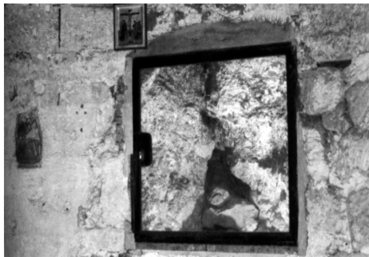
Трещина в часовне Главы Адама

В Церкви сложилась иконографическая традиция изображения креста, стоящего на не-