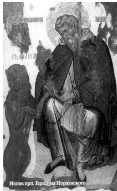
Икона прп. Герасима Иорданского