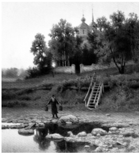
Ефим Волков. У монастыря